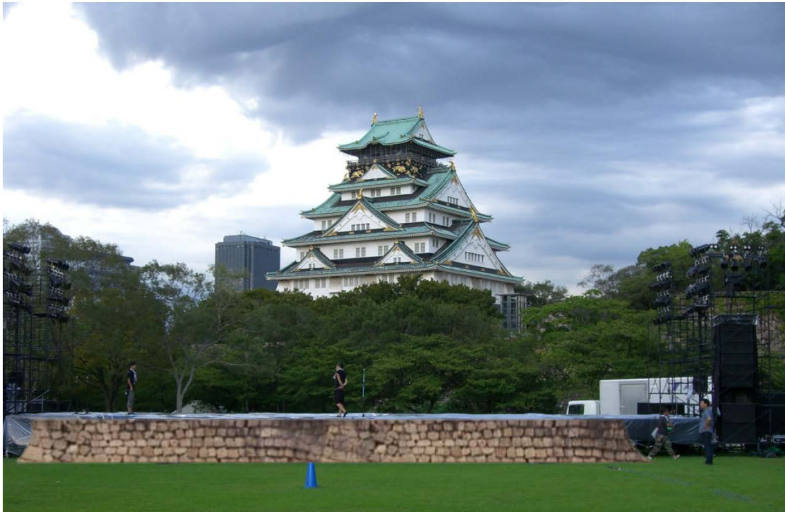
イメージ① 石垣ステージ