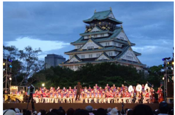
西の丸ステージで指揮する藤岡幸夫氏