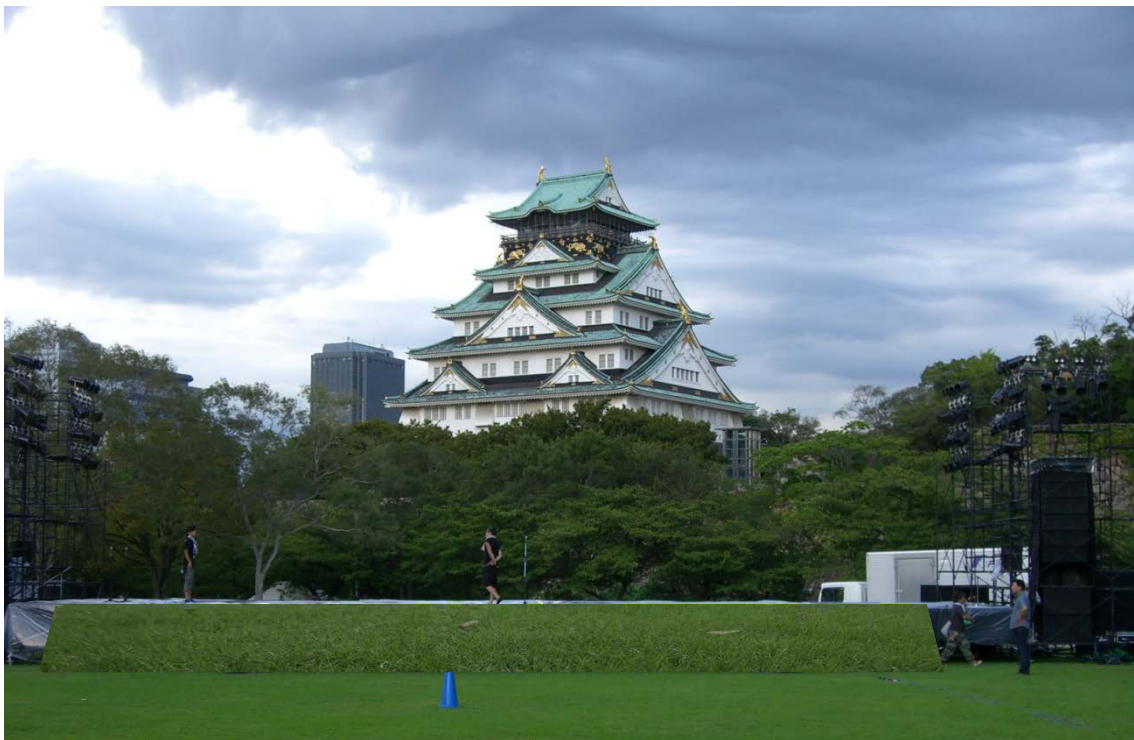
イメージ② (代替案) 緑化エステージ