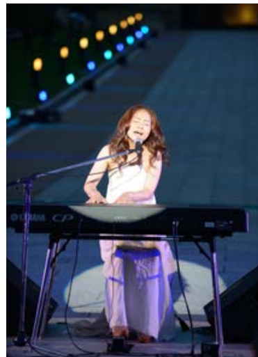
2012年の「オープニング・ガラ」から