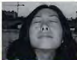
Nunu/中国 振付家/ダンサー