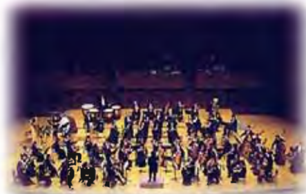
関西フィルハーモニー管弦楽団