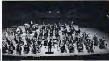
関西フィルハーモニー管弦楽団