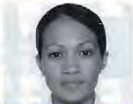
Elena Ortizo Lanio/フィリピン 振付家/ダンサー、フィリピン大学付属ダンス カンパニーレジダンス・コレオグラファー