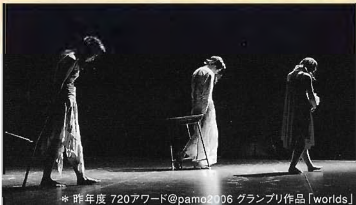
* 昨年度 720アワード@pamo2006 グランプリ作品「worlds」

2人の振付家によるコンテンポラリーダンス・ユニット。劇団hmpに所属していたメンバー3名によって結成、独自の活動を開始。ダンステクニックだけにとらわれず、音や照明、美術の作る空間にダンサーがどのように存在できるか、またそれらが生みだす時間やリズムに重きをおいた創作活動を行っている。2004年12月dance circus28で「...st.」を発表。以降、[踊りに行くぜvol.6vol.7関西選考会]や[神楽坂die pratz ダンスが見たい新人シリーズ4]にノミネート。2006年6月[dance box selection15]に選出。7月には[720アワード@pamo]でグランプリを受賞。現在大阪・京都を中心に活動中。