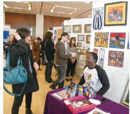
昨年度の会場風景