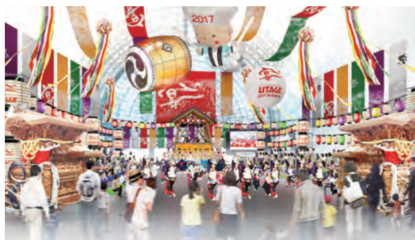
2017 食博覧会・大阪 (イメージ図)(大阪市住之江区・インテックス大阪)

オリンピック憲章は、オリンピック開催にあたり、スポーツだけでなく教育を含めた文化オリンピアード(Cultural Olympiad)の実施を義務づけている。これに則り、文化庁は2020年東京オリンピック・パラリンピック競技大会を契機に、文化の祭典として史上最大規模の文化プログラムに取り組む基本構想を発表。幅広い関係者と連携しつつ、全国津々浦々で魅力ある文化プログラムを展開し、国内外の人々を日本文化で魅了すべく取り組みを始めている。