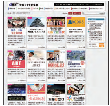
関西・大阪21世紀協会ホームページ

古代から近世にかけて、「なにわ大坂」をつくってきた100人を選抜。 9人の執筆陣が、ゆかりの人々へのヒヤリングや現地取材を通して、歴史を動かした傑人たちの知られざる一面に迫ります。 今秋より、当協会ホームページで順次公開してまいります。