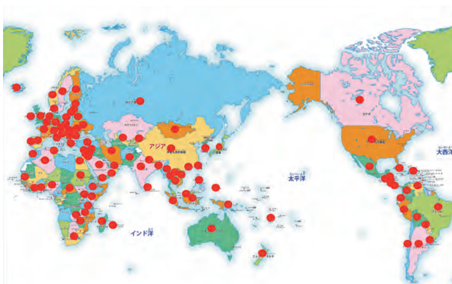
45年間に109の国と地域の活動を助成(日本万国博覧会記念基金[1971年設立])