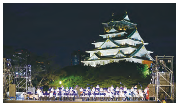
大阪城西の丸ステージウィーク (2012年7月・西の丸庭園特設ステージ)