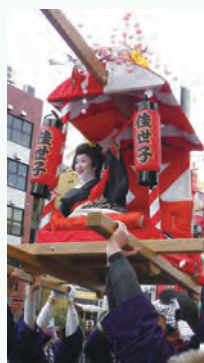
2015年1月10日の実施風景

今宮戎神社十日戎の奉納行事として、江戸時代からの伝統を持つ行事。明治以降は花街の誘客手段となり、現在は経済界や地元商店会などの協力で開催されています。