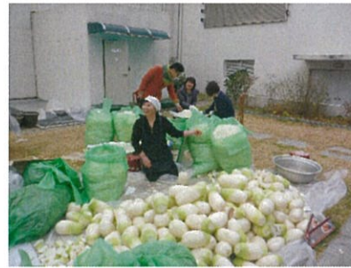
韓国国立民俗博物館の職員食堂でのキムジャン