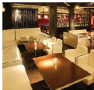
(すべてイメージ図)

水・桜・風に包まれたもう一つの至福のリビング グループや恋人同士、ファミリーに対応できるラグジュアリーなソファ席 プライベートで過ごす「今」は移ろいゆく季節を自身の記憶の中にしっか りと取り込んでくれることでしょう。