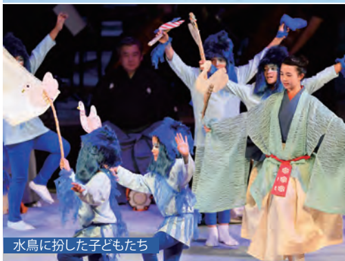
水鳥に扮した子どもたち