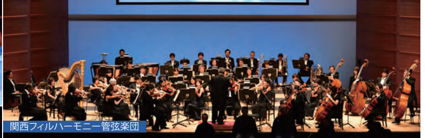
関西フィルハーモニー管弦楽団