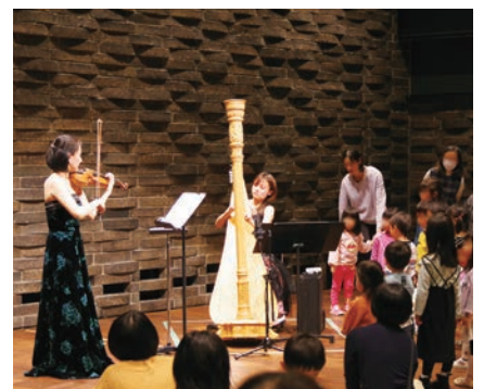
「おでかけクラシック vol.4」楽器の近くで演奏を聴く子どもたち／場所：枚方市総合文化芸術センター

を演奏しました。途中「もっと楽器のそばに来てもいいよ」と呼びかけると、子どもたちは目を輝かせてハープの周囲に集まり、普段あまり触れることのない生の楽器の音色に熱心に聞き入っていました。