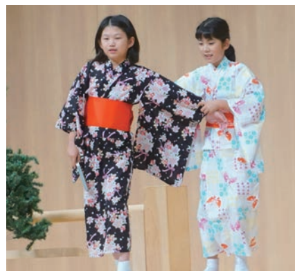
「第11回夏休みキッズ狂言会2023」子どもたちによる成果発表風景 場所：神戸市立灘区民ホール

たちは狂言の所作や声の抑揚を体で覚え、参加者全員が100名を超える聴衆の前でそれぞれ見事に狂言を演じ切りました。