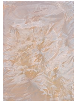
「薫りのささやきと」展より Yukawa-Nakayasu 《remule》(2023) 場所：イチノジュウニノヨン

ねて生み出されるもので、作家の作為性と偶然の狭間に生じる美しさが際立ちます。それはまた、私たちの感覚にささやくように働きかける薫りのように、揺れ動く私たちの心とそれを支える身体の関係を示唆するものでもあります。