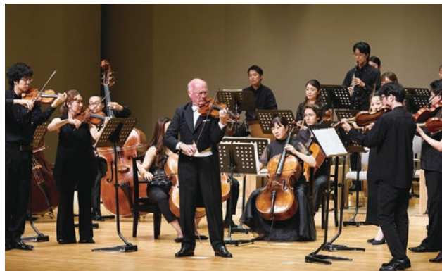
「第6回スーパークラシックアンサンブル特別公演」演奏風景 場所：吹田メイシアター