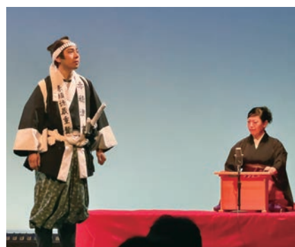
「第3回大阪演劇見本市」講談と演劇のコラボレーション公演風景 場所：グランフロント大阪ナレッジシアター

いる場面が、時代劇の衣装を身に着けた俳優たちによって描写され、まるで無声映画の実写版を見ているよう。生の舞台の醍醐味が堪能できた舞台となりました。